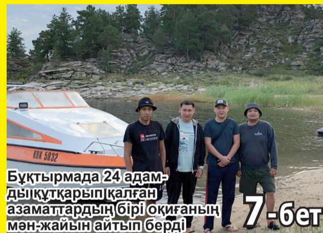
Бұқтырмада 24 адамды құтқарып қалған азаматтардың бірі оқиғаның мән-жайын айтып берді