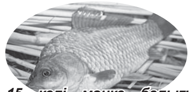
15 келі мөңке балығы табылды.

Келтірілген шығын 445 000 теңгеден астам сомаға бағаланады.