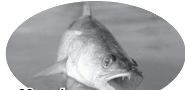
32 келі көксерке