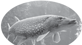
Ұсталған адамның көлігінен 38 келі шортан

Сақшылар таңертең Алғабас ауылынан 6 шақырым жердегі саяжай жолында 85 келі балық әкеліп бара жатқан 49 жастағы жергілікті тұрғынды тоқтатқан.