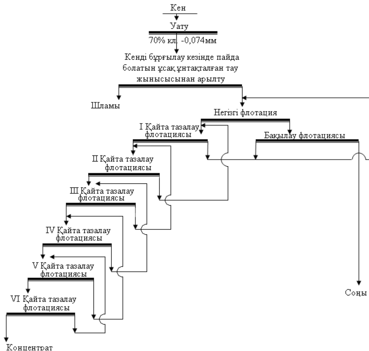
Сурет 3 – Қаражал кен орнындағы орташа кенді байытудың технологиялық сызбасы

Төртінші тарауда зертханалық жағдайда үздіксіз технологиялық үдерісті өндіру бойынша өткізілген эксперименттердің нәтижелері көрініс тапты. Сызбалық тәжірибелер сурет 3-те көрсетілген сызба бойынша тандап алынған оңтайлы технологиялық параметрлер негізінде жүргізілді. Жүргізілген зерттеу нәтижесінде \text{CaF}_2 73% шығарған кезде ФФ-95А химиялық сұрпының шартқа сәйкес флюориттік концентраты алынды.