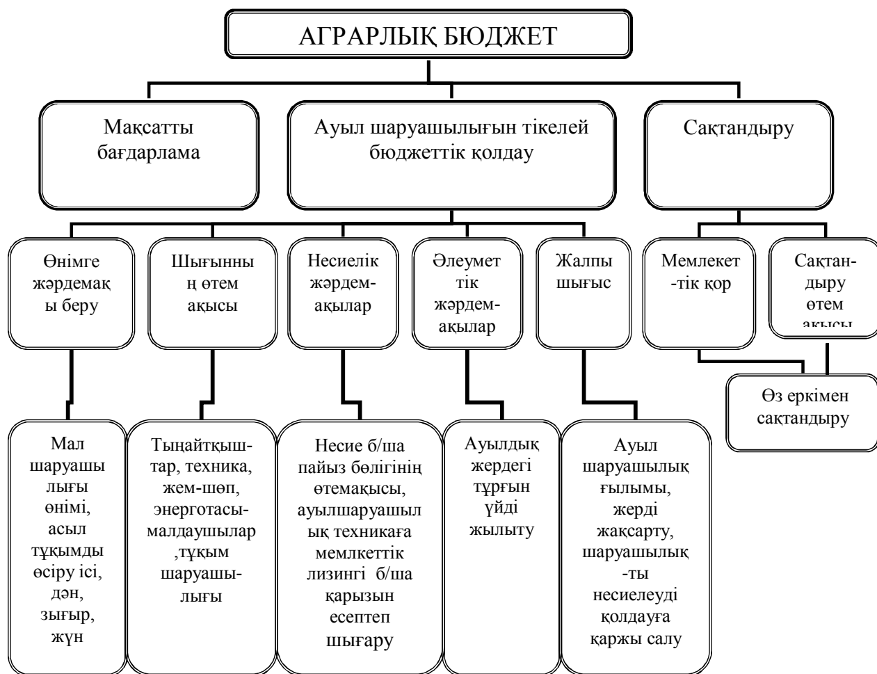
Сурет 1 - АӨК мемлекеттік қаржыландыру жүйесі

Екінші бөлімде Шығыс Қазақстан облысының аймақтары бойынша зерттеудің жалпы әдістемелік талдауы келтірілген. Шығыс Қазақстан облысының аймақтары бойынша бес жылға ауыл шаруашылық өнімдерінің жалпы көлемінің талдауы, агрокәсіпкерлердің саны және екінші деңгейлі банкпен мемлекеттік бағдарламаны орындау кезіндегі берілген несиелердің көлеміне талдауы жүргізілген.