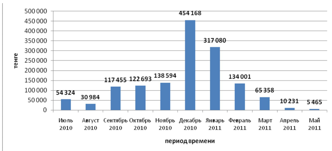
Рисунок 2 – Динамика затрат на покупку балансирующей электроэнергии

Затраты на покупку дисбалансов электрической энергии на балансирующем рынке отображены на рисунке 2.