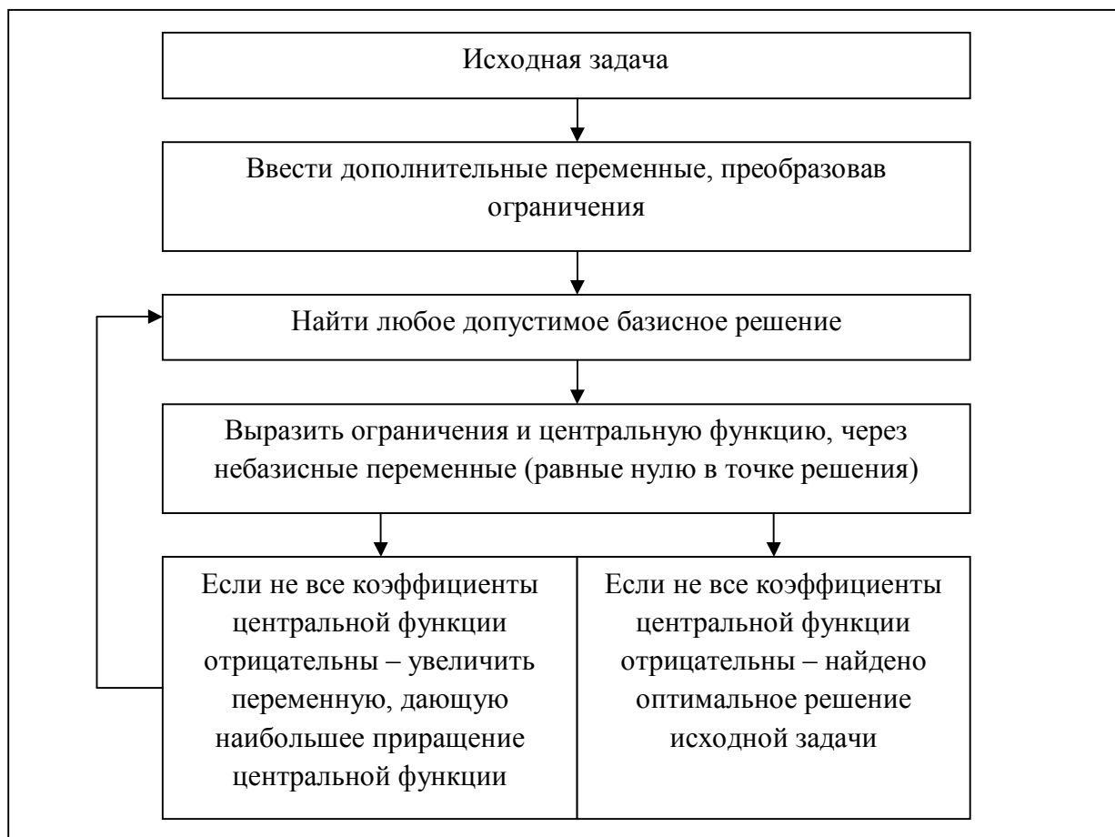
Рисунок 1 – Схема процесса обработки информации симплексным методом

исследуемыми показателями и соответствующая степень влияния анализируемого фактора на исследуемый показатель.