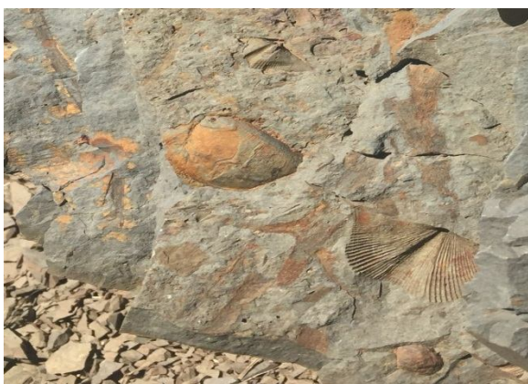
Тарханский геологический разрез