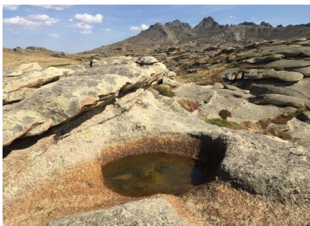
Урочище Аир с Монастырскими озерами