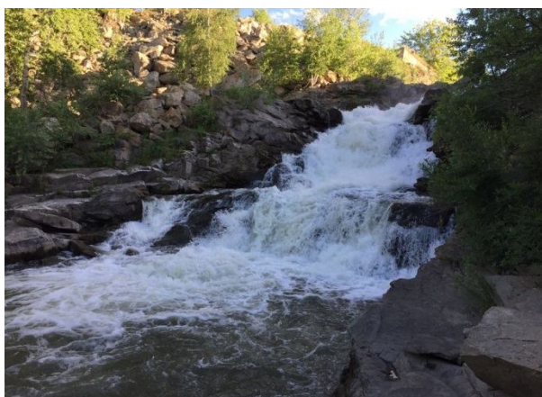
Редкометальные пегматиты Калбы (п. Асу-Булак)